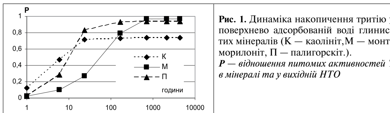
Рис. 1. Динаміка накопичення тритію у поверхнево адсорбованій воді глинистих мінералів (К — каолініт, М — монтморилоніт, П — палигорскіт.). P — відношення питомих активностей T в мінералі та у вихідній НТО

Можливість та інтенсивність накопичення тритію в глинистих мінералах значною мірою визначається швидкістю дифузії молекул НТО у вільній воді, що оточує мінеральні частинки, у поровій та капілярній воді, як транзитному середовищі, на поверхнях мінеральних частинок та в міжшаровому просторі. У дрібнодисперсних водно-мінеральних системах з надлишком води створюються майже ідеальні умови для обміну між молекулами НТО вільної води та мінеральними частинками. Тому адсорбована вода, яка видаляється з мінералу після його взаємодії з НТО, має лише дещо меншу питому активність тритію, ніж вихідна НТО (рис. 1), та досить велику швидкість досягнення рівноважного стану [5, 6].