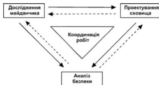
Рис. 1. Прямі (суцільні) і зворотні (пунктирні лінії) інформаційні зв'язки між роботами з дослідження майданчика, проектування і аналізу безпеки геологічного сховища [6].

Прямі і зворотні інформаційні зв'язки між пов'язаними видами діяльності наведено на рис. 1.