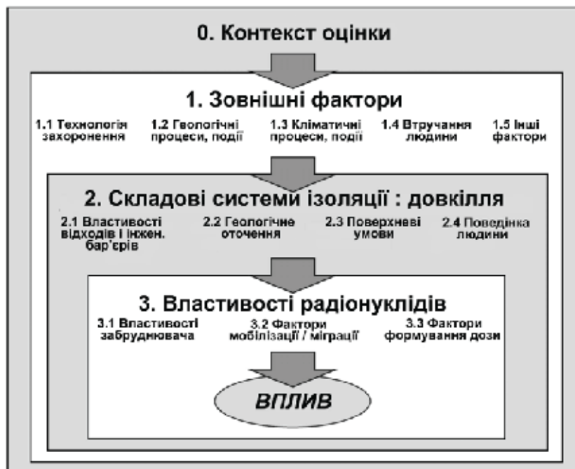
Рис. 2. Організаційна структура міжнародної бази даних властивостей, подій і процесів, що дозволяють оцінити безпеку систем геологічної ізоляції РАВ [8].

Важливим аспектом цієї бази даних є те, що вона включає нульову групу ВПП — «Контекст оцінки», де міститься перелік можливих кінцевих цілей виконання аналізу безпеки (оцінка доз; оцінка ризиків; оцінка концентрації радіонуклідів в біосфері, тощо). Саме попередньо вибрана кінцева мета і є визначальною для складу ВПП, що можуть сприяти її досягненню.