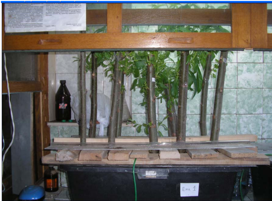
Рис.2. Постановка експерименту

пагони (20-30 см), щільно вкриті листям. Готові до експерименту рослини обережно викопували та переносили у пластикову прямокутну ємність об'ємом 77 л. (рис. 2). У ємність було уміщено 11 саджанців. Далі в неї залили 68,5 л відстояної водопровідної води з фоновим вмістом тритію 7 \text{ Бк} \times \text{дм}^{-3} та витримали рослини ще один тиждень для акліматизації. Через воду протягом всього експерименту пропускали невеликий потік повітря для запобігання гнилісних процесів.